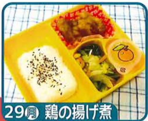
29 月 鶏の揚げ煮