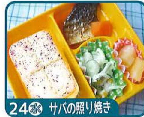
24 水 サバの照り焼き