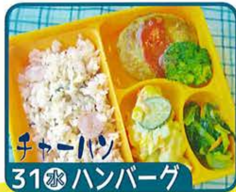
チャーハン 31 水 ハンバーグ