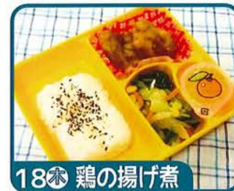
18 水 鶏の揚げ煮