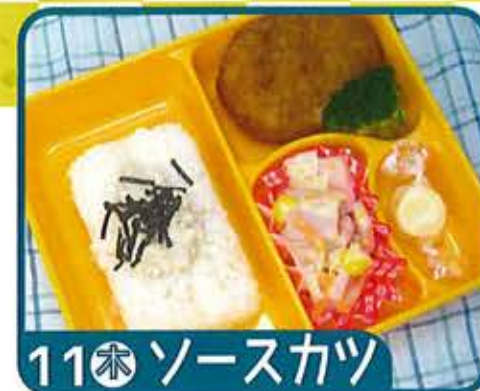
11 水 ソースカツ