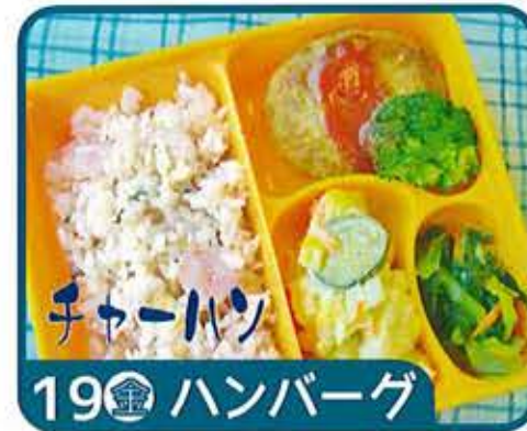
チャーハン 19 金 ハンバーグ