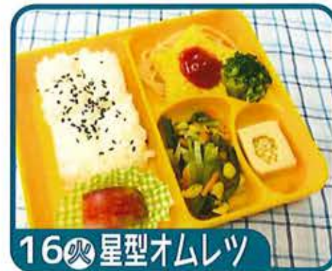
16 火 星型オムレツ