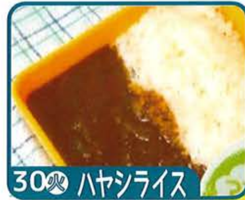
30 火 ハヤシライス