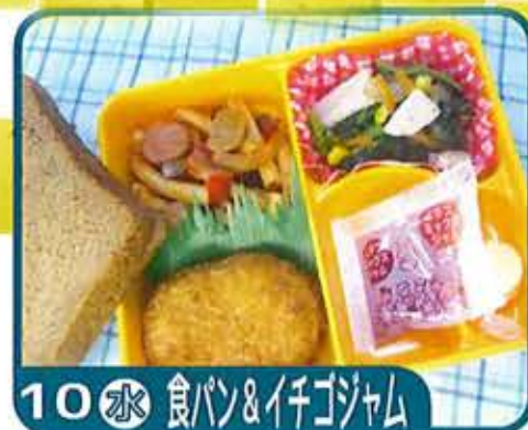
10 水 食パン&イチゴジャム