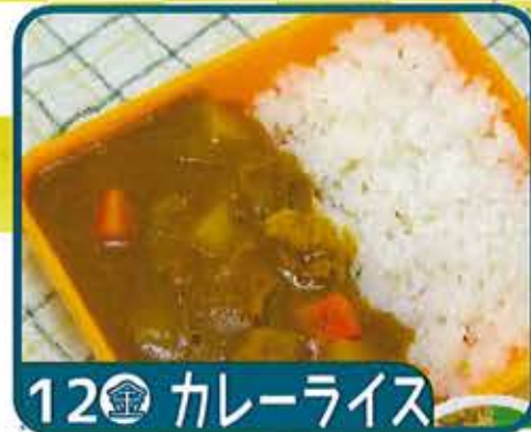
12 金 カレーライス