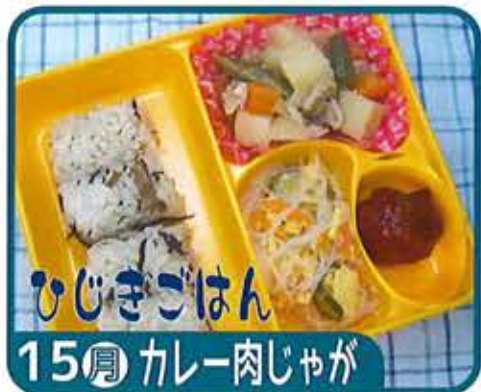
ひじきごはん 15 月 カレー肉じゃが