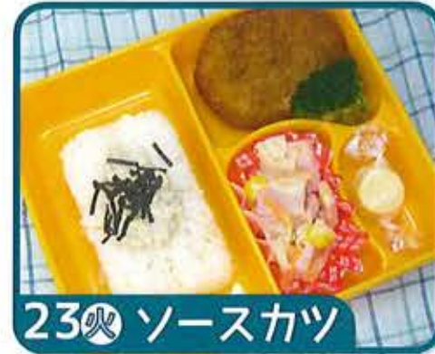
23 火 ソースカツ