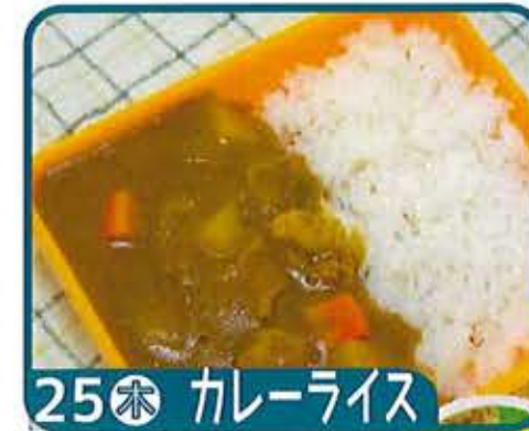
25 水 カレーライス