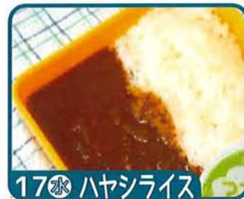
17 水 ハヤシライス