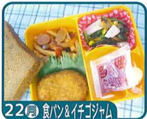
22 月 食パン&イチゴジャム