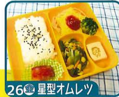
26 金 星型オムレツ