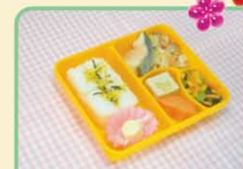
12 木 しろみざかなのオーロラソース