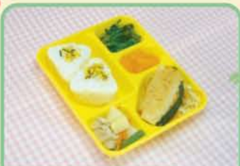
31 火 いかのゆずみそやき