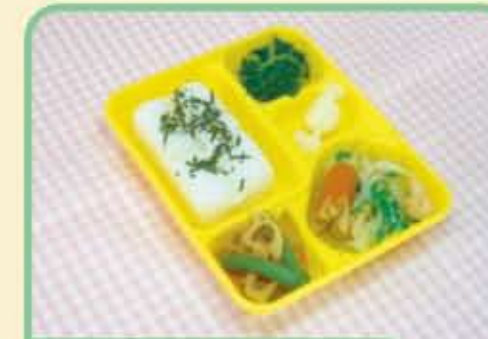
27 金 かいせんいため