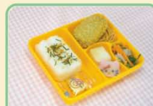
11 水 ポテトコロッケ