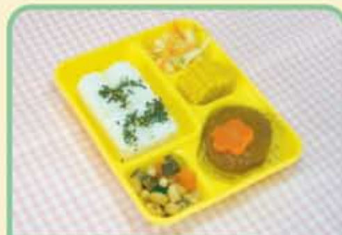
23 月 にこみハンバーグ