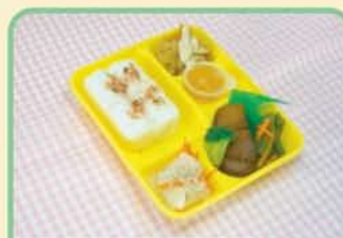
6 金 カレイのつけ