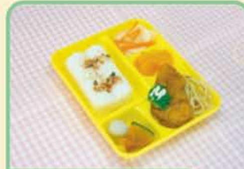
25 水 といのからあげ