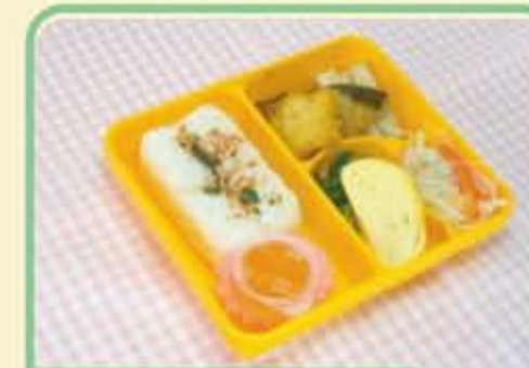
19 木 ぶりのていやき