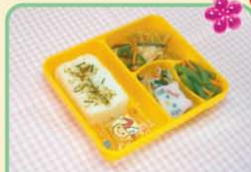
30 月 さけのちゃんちゃんやき