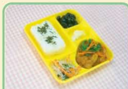
10 火 すどい