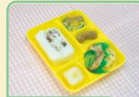
20 金 ぶたヒシのチーズパンごやき