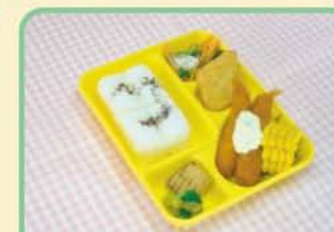
13 金 エビフライ～タルタルソース～